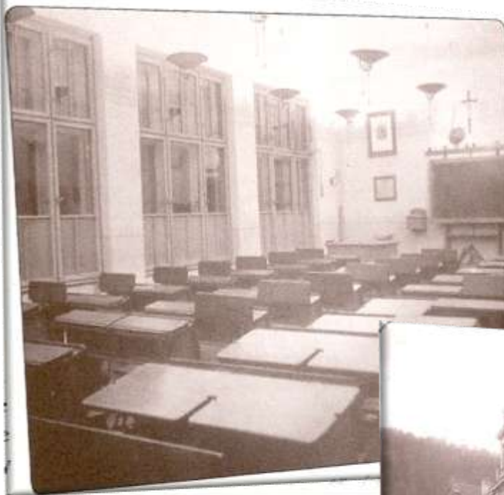
Vybavení třídy za Rakouska-Uherska a škola v roce 1903

Kiprov J., Vlnatá D.: Almanach ZŠ Dukelských hrdinů